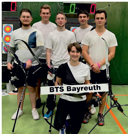
BTS Team Bundesliga